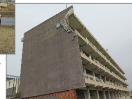
図-3 気仙沼市 東日本大震災遺構・伝承館