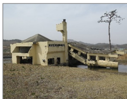
図-2 一本松とユースホテル